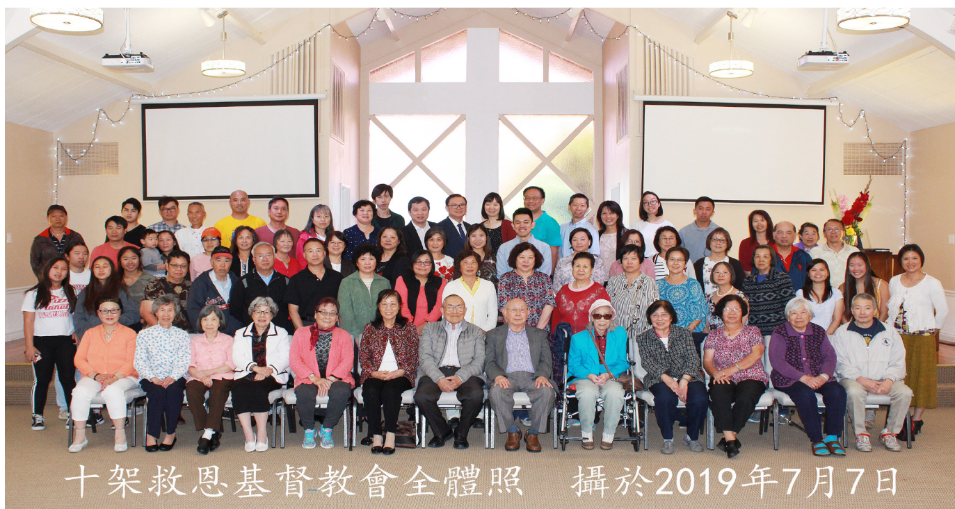
十架救恩基督教會全體照 攝於2019年7月7日

向上看 .....擺在我們面前的道路，讓我們一起舉目向上看，仰望我們信心創始成終的主耶穌，力量的源頭，讓我們向天舉起雙手來讚美神，「願你晝夜看顧這殿，就是你應許立為你名的居所，求你垂聽僕人向此處禱告的話」(列王紀上8:29)。