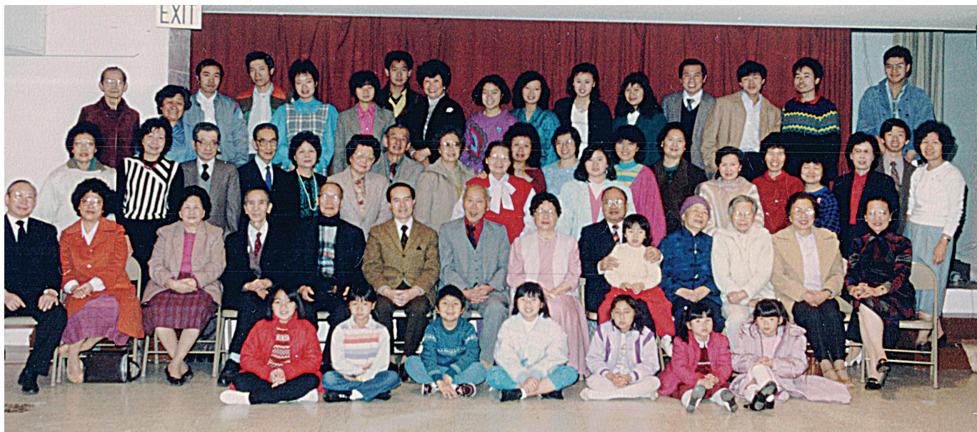
1987 Brookside Baptist Church Chinese speaking congregation

After continuous prayer, we formed the building fund committee. They started to ask members and other brothers and sisters shared common vision to raise money for purchasing of our own building. Praise the Lord, in less than 3 months, we already raised $50,000. We then notified Brookside Baptist Church to end the contract, and we registered with the State of California under the name Chinese Church of Christ in Oakland (later renamed to Oak-