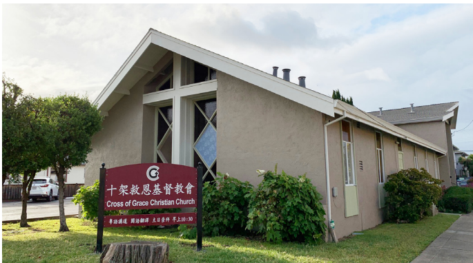
2018年7月十架救恩基督教會搬來San Leandro

其後購入商住兩用單位，約2,000呎於2542 MacArthur Blvd., Oakland, CA.94602. 但又因教會向銀行借貸產生問題，故向賣主表明難處。感謝主，賣主是基督徒，答應直接貸款給我們，但要加0.5%利息，此處又經歷了神的恩典。