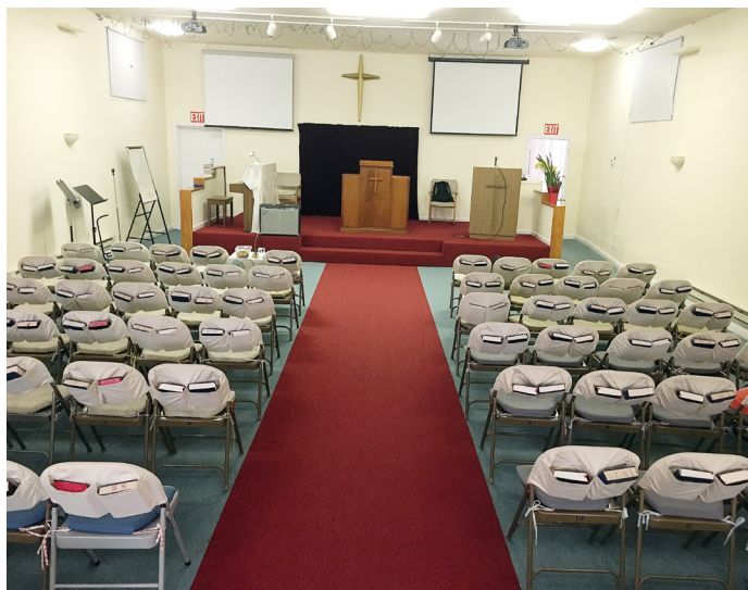
The previous chapel at 2578 MacArthur Blvd.

As the church continue to grow, we found the original site is no longer suitable, and must be expanded. We continually looking for a larger space. Coincidentally, there was an old print shop for sale at 2578-2582 MacArthur Blvd. in Oakland. After the brothers and sisters looked at the building, we agreed that God prepared this print shop for the church. It