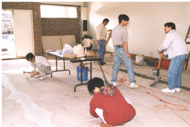
1995-96年屋崙華人基督教會建堂，弟兄姊妹參與裝修

建堂委員會立即向聯邦政府立案，命名為「屋崙華人基督教會」Chinese Church of Christ in Oakland。