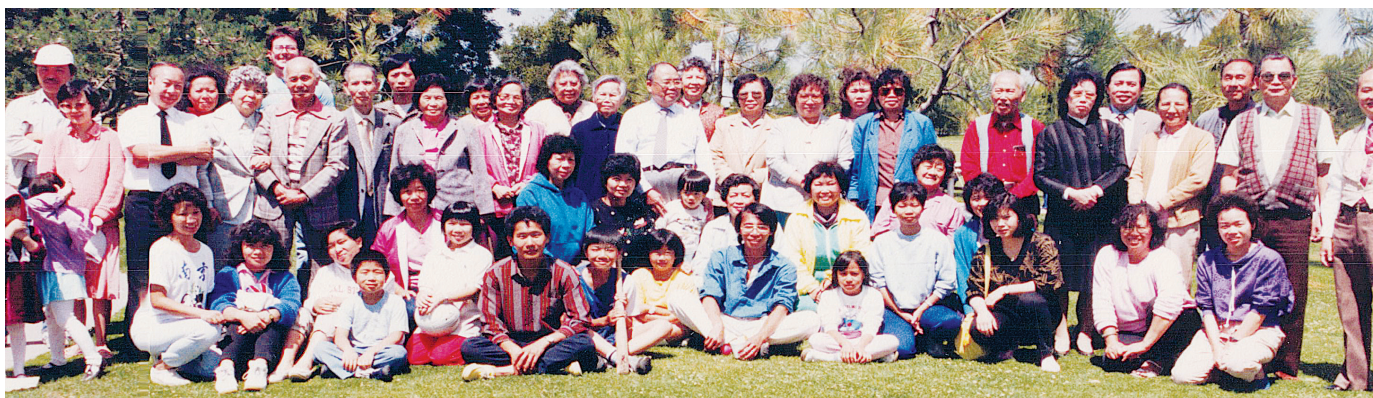
1986年真理福音教會與溪邊浸信聯合郊遊